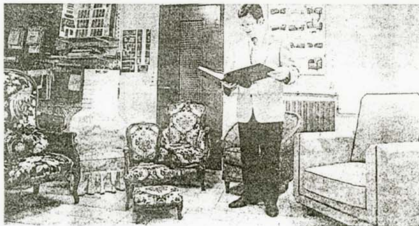
La surface de l'atelier vient de quadrupler.

général... l'ont d'ailleurs bien compris en encourageant cette initiative en finançant très promptement des visiteurs et de nombreux discours d'encouragements.