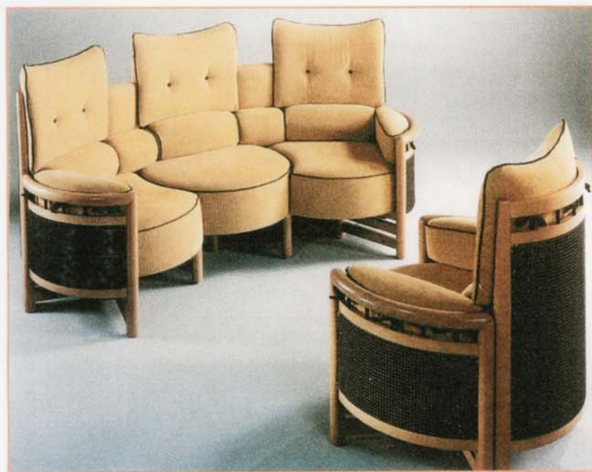
"INFINI" Salon modulable et intemporel

Très rapidement, grâce à un système de fixation ingénieux, les fauteuils peuvent